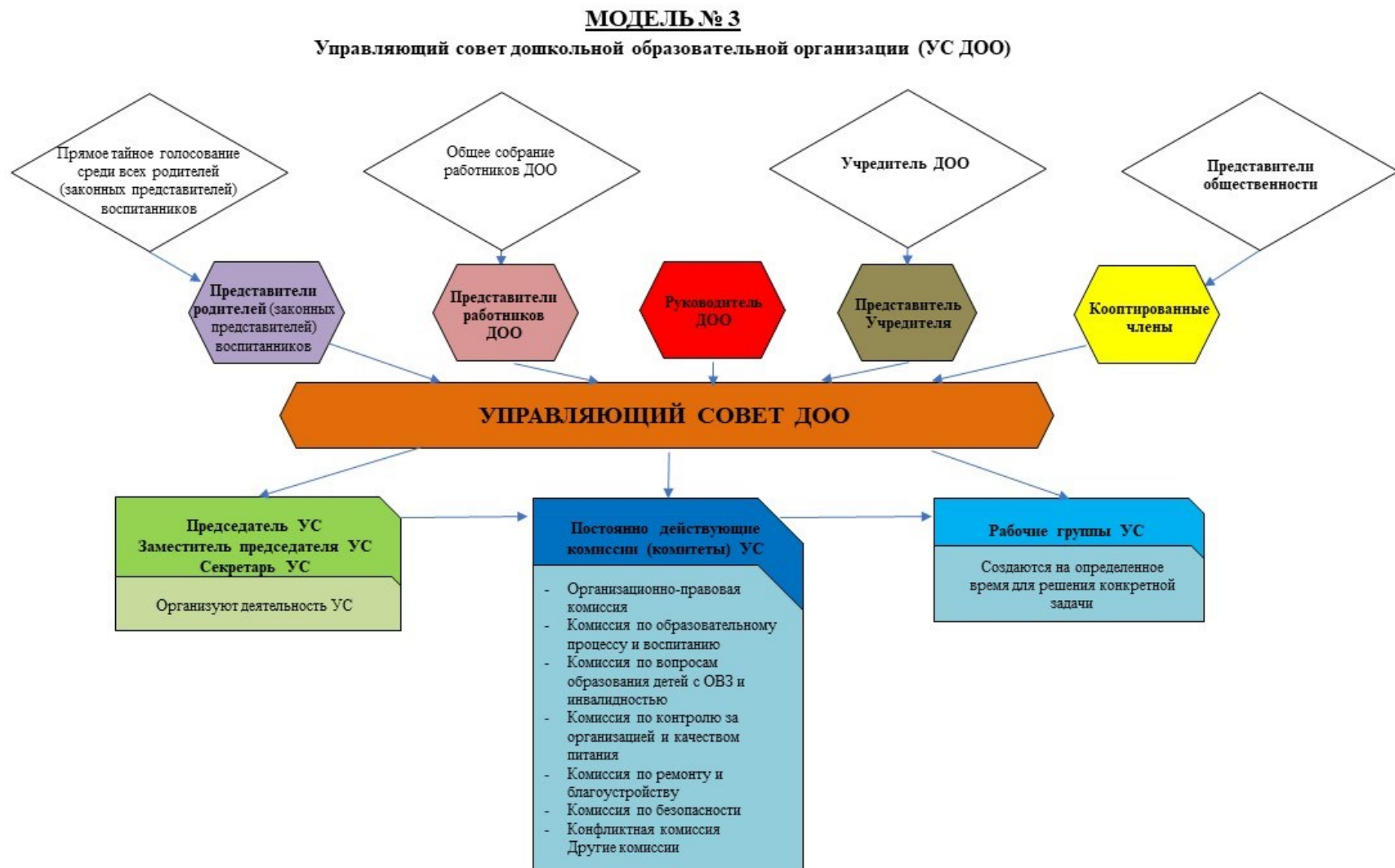
Рис. 3. Модель № 3 – «Управляющий совет дошкольной образовательной организации» (УС ДОО)