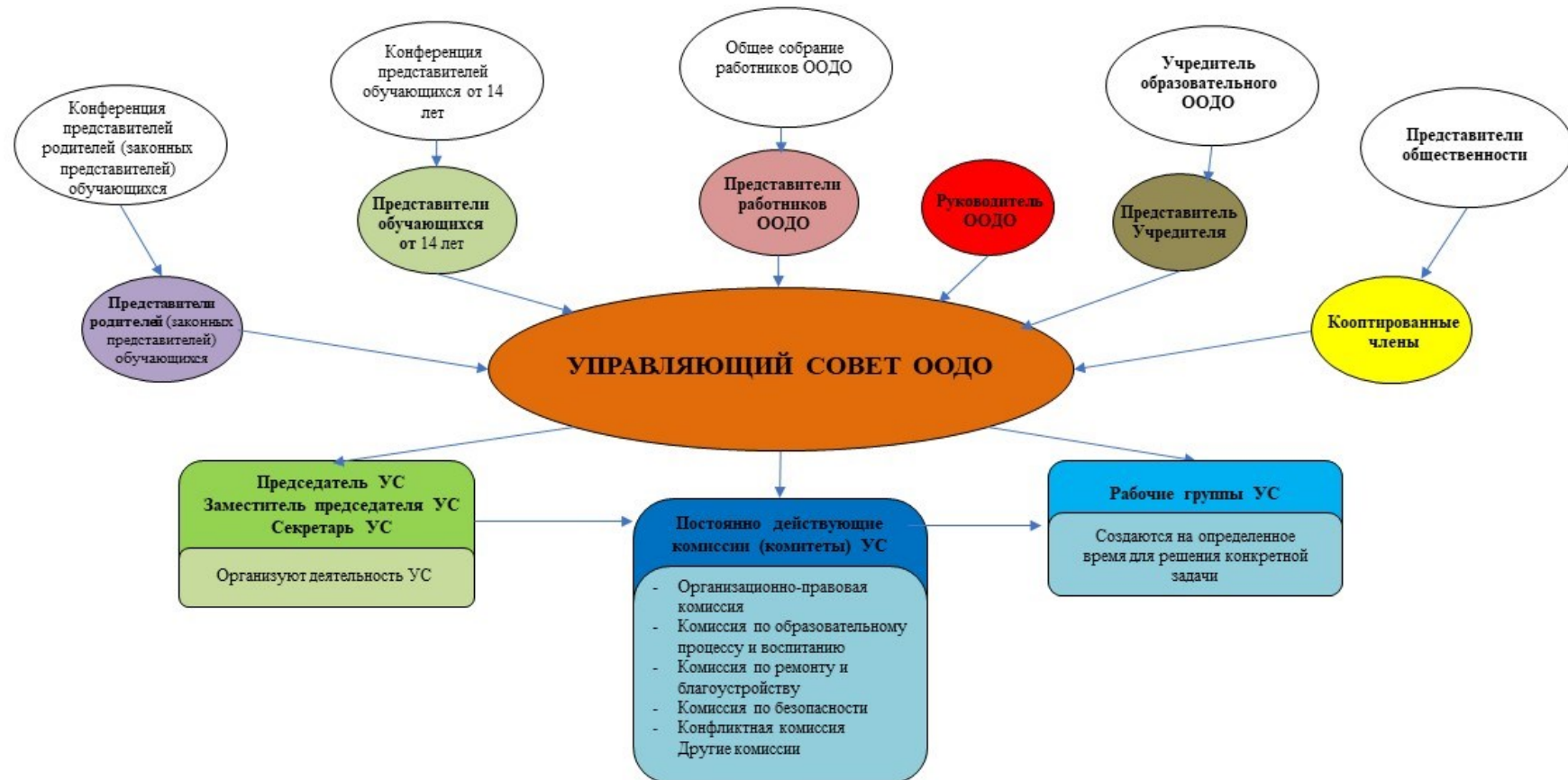
Рис. 2. Модель № 2 – «Управляющий совет образовательной организации дополнительного образования» (УС ООДО)