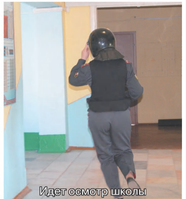
Идет осмотр школы