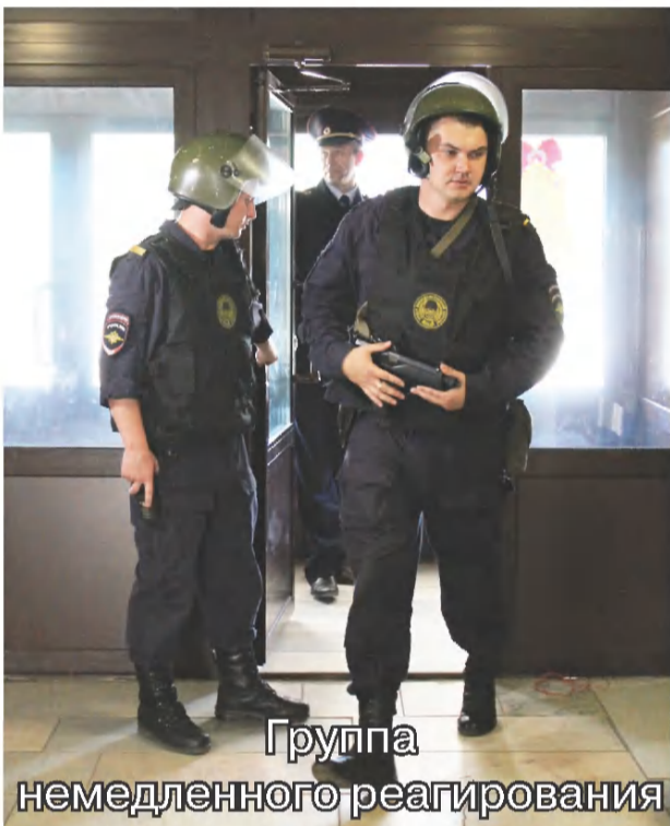
Группа немедленного реагирования