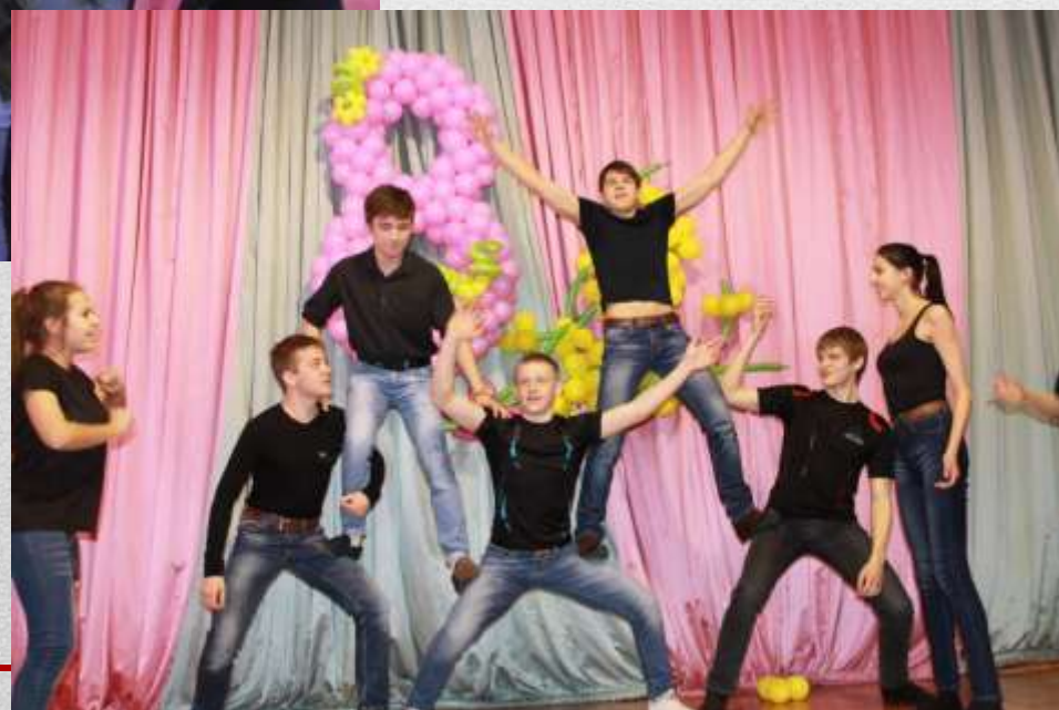
Концерт к 8 марта