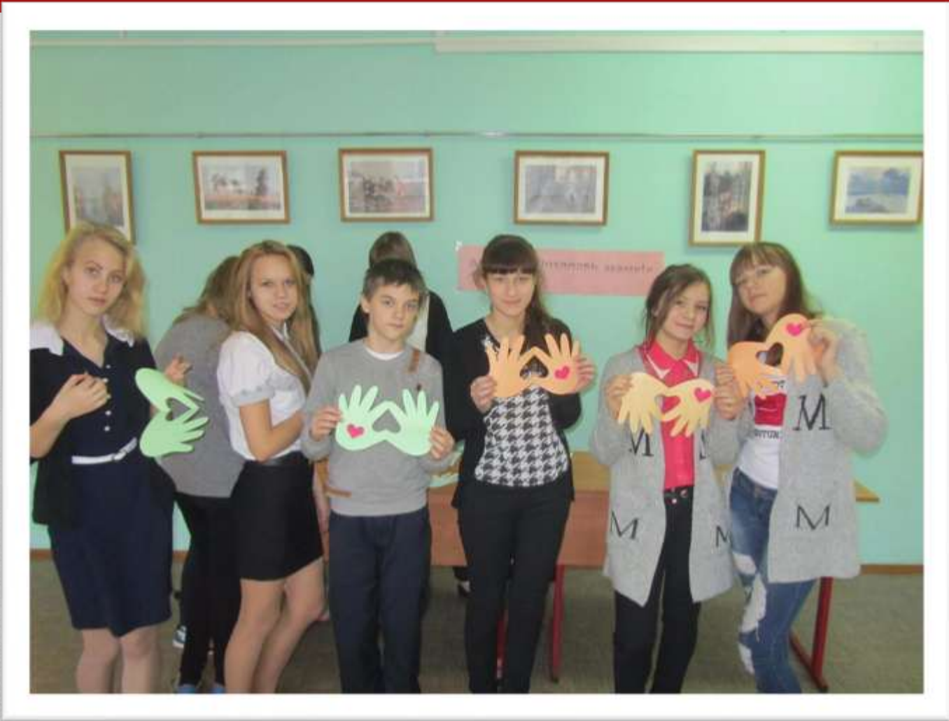
Акция к Дню матери «Поздравь маму»