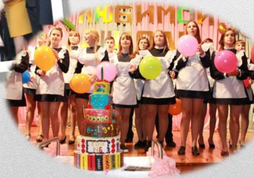
Школе – 35 лет