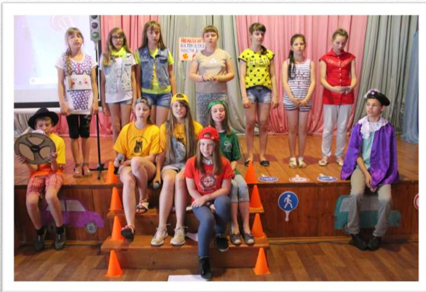
Дорожный спектакль по ПДД