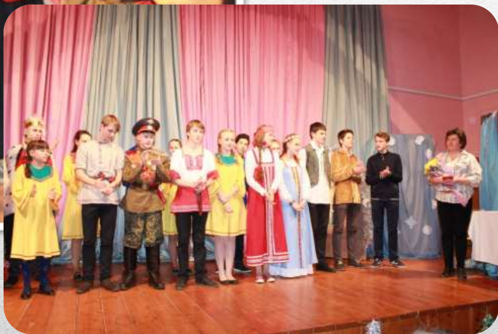
Постановка спектакля «Про Федота-стрельца, молодого удальца»